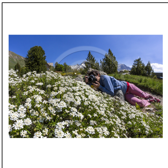
Hautes-Alpes (05), Villar d'Arène, col du Lautaret, Station alpine Joseph Fourier, Jardin Botanique Alpin du Lautaret et la massif de la Meije // Hautes-Alpes (05), Villar d'Arene, Lautaret, Alpine Resort Joseph Fourier, Alpine Botanical Garden Lautaret and the massif Meije