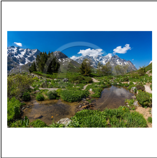
Hautes-Alpes (05), Villar d'Arène, col du Lautaret, Station alpine Joseph Fourier, Jardin Botanique Alpin du Lautaret et la massif de la Meije // Hautes-Alpes (05), Villar d'Arène, Lautaret, Alpine Resort Joseph Fourier, Alpine Botanical Garden Lautaret and the massif Meije