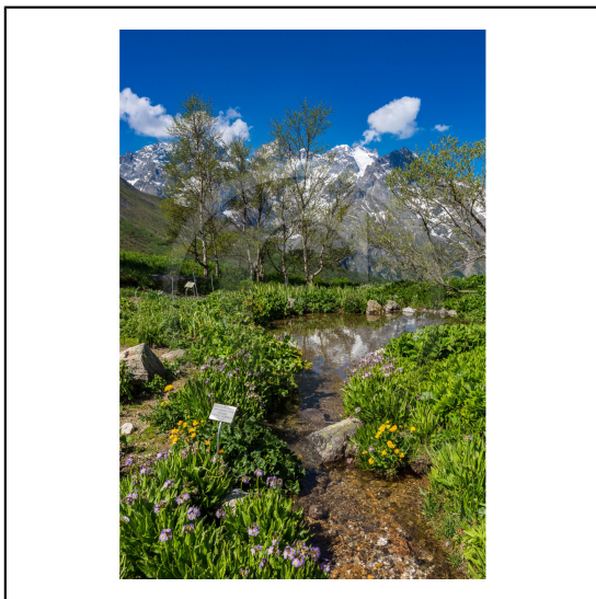
Hautes-Alpes (05), Villar d'Arène, col du Lautaret, Station alpine Joseph Fourier, Jardin Botanique Alpin du Lautaret et la massif de la Meije // Hautes-Alpes (05), Villar d'Arene, Lautaret, Alpine Resort Joseph Fourier, Alpine Botanical Garden Lautaret and the massif Meije