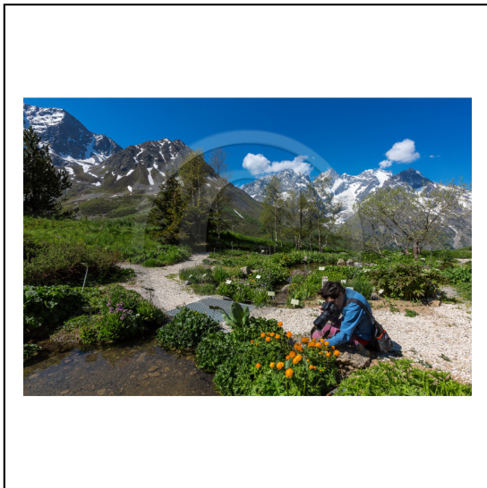
Hautes-Alpes (05), Villar d'Arène, col du Lautaret, Station alpine Joseph Fourier, Jardin Botanique Alpin du Lautaret et la massif de la Meije // Hautes-Alpes (05), Villar d'Arene, Lautaret, Alpine Resort Joseph Fourier, Alpine Botanical Garden Lautaret and the massif Meije