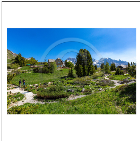
Hautes-Alpes (05), Villar d'Arène, col du Lautaret, Station alpine Joseph Fourier, Jardin Botanique Alpin du Lautaret et la massif de la Meije // Hautes-Alpes (05), Villar d'Arene, Lautaret, Alpine Resort Joseph Fourier, Alpine Botanical Garden Lautaret and the massif Meije