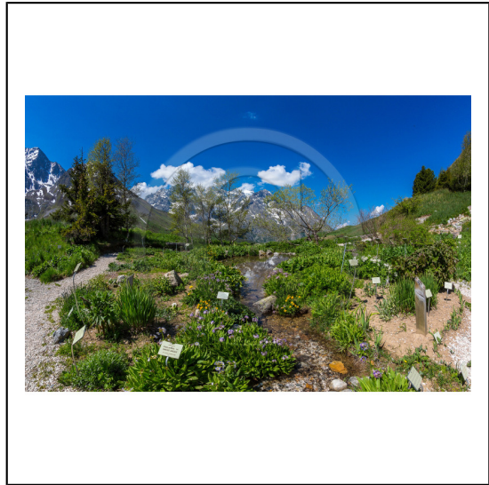
Hautes-Alpes (05), Villar d'Arène, col du Lautaret, Station alpine Joseph Fourier, Jardin Botanique Alpin du Lautaret et la massif de la Meije // Hautes-Alpes (05), Villar d'Arène, Lautaret, Alpine Resort Joseph Fourier, Alpine Botanical Garden Lautaret and the massif Meije