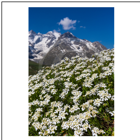
Hautes-Alpes (05), Villar d'Arène, col du Lautaret, Station alpine Joseph Fourier, Jardin Botanique Alpin du Lautaret et la massif de la Meije // Hautes-Alpes (05), Villar d'Arene, Lautaret, Alpine Resort Joseph Fourier, Alpine Botanical Garden Lautaret and the massif Meije