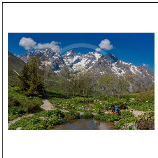
Hautes-Alpes (05), Villar d'Arène, col du Lautaret, Station alpine Joseph Fourier, Jardin Botanique Alpin du Lautaret et la massif de la Meije // Hautes-Alpes (05), Villar d'Arene, Lautaret, Alpine Resort Joseph Fourier, Alpine Botanical Garden Lautaret and the massif Meije