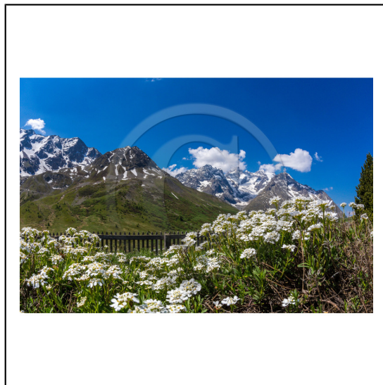
Hautes-Alpes (05), Villar d'Arène, col du Lautaret, Station alpine Joseph Fourier, Jardin Botanique Alpin du Lautaret et la massif de la Meije // Hautes-Alpes (05), Villar d'Arene, Lautaret, Alpine Resort Joseph Fourier, Alpine Botanical Garden Lautaret and the massif Meije